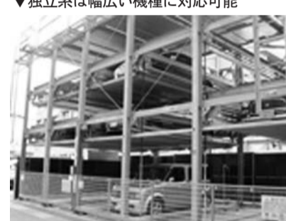
独立系は幅広い機種に対応可能